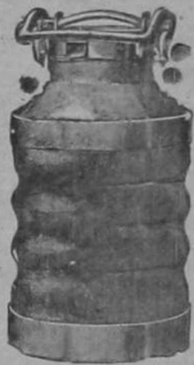
pinturas Alabastin etc.

CATRES Americanos grandes y pequeños. Felpudos Mangueras alambradas.