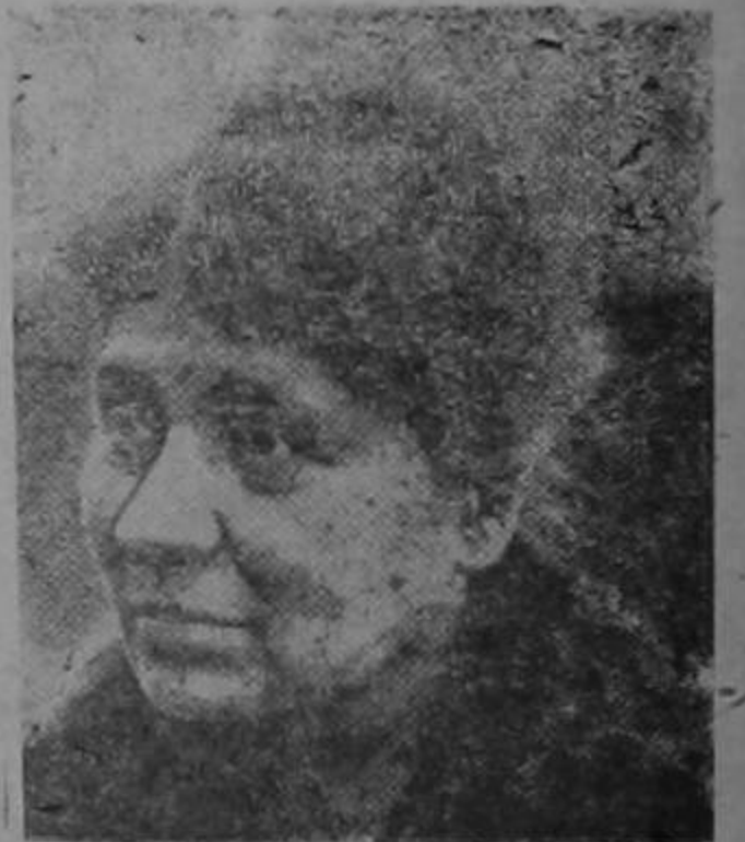
la primera abogada francesa, que va a celebrar el 25° aniversario de su entrada al Palacio de Justicia