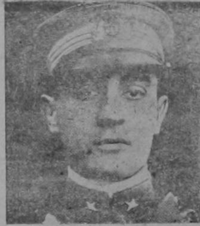
Roma.—El aviador italiano Casagrande, que va a llevar a cabo el raid Italia-Argentina

Oficina en la calle de la Sabana, 250 al Oeste (para abajo) del Mercado por la línea del tranvía frente al Suich de la antigua cárcel hoy el Hospital casi frente a Lacelona.